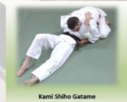
Kami Shiho Gatame