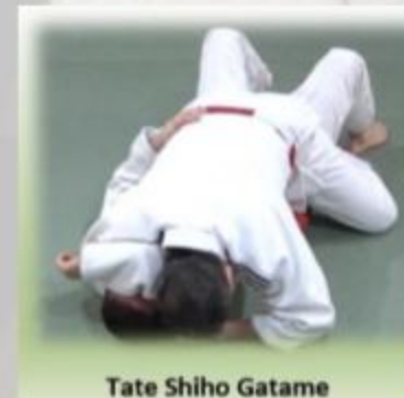
Tate Shiho Gatame